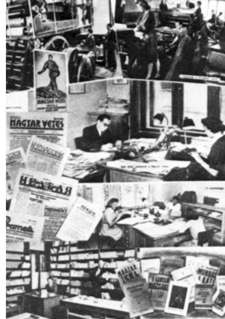
Az íráshoz tartozó illusztrációk forrása: Tóth Imre: KALOT képeskönyv, 1989

Az íráshoz tartozó színes fotókat a 2. oldalon közöljük.